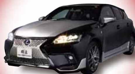
博多織をはじめとした伝統工芸と最先端の自動車の融合 九州オリジナルカスタマイズカー「輝匠」